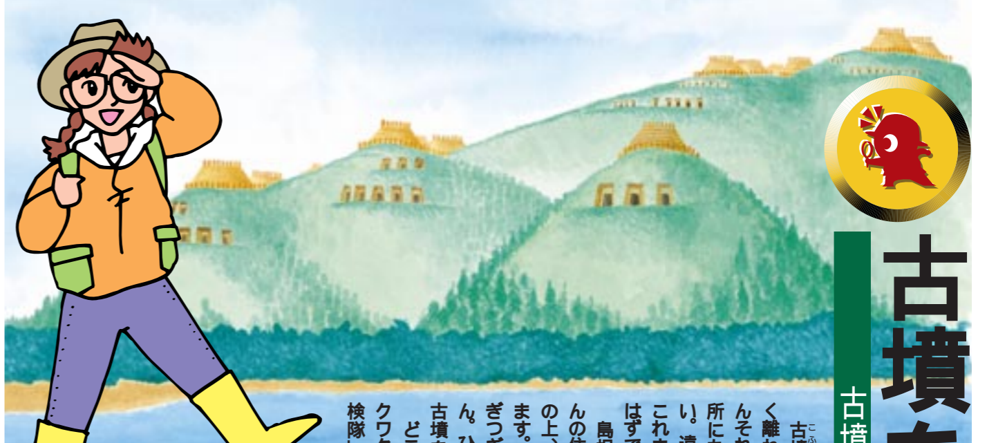
矢田古墳群想像図

島根県は、古墳の多い地域です。現在みなさんの住んでいる平野に面した丘陵の上や、台地の上、そして平野の中にも見つけることができます。一つ古墳を見つけて「コツをつかめば、つぎつぎと古墳を見つかることも夢ではありません。ひょっとしたら、まだ誰も知らない、大きな古墳を見つかることができるかもしれません。どこでも、誰にでもつき、そしてちょっとワクワクする古墳探し。さあ、あなたも「古墳探検隊」と一緒に出発しよう。