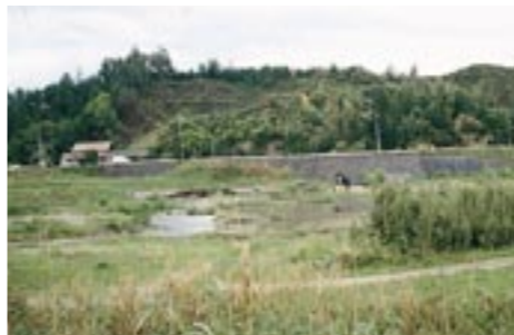
矢田古墳群(安来市矢田町)