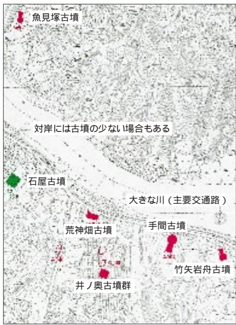
松江市遺跡地図より