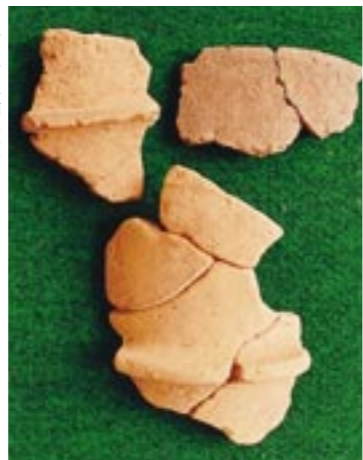
円筒形埴輪の破片

古墳のまわりを探したとき、いちばん多く見つかる埴輪の破片は、円筒形埴輪です。一見ふつふつの土器のようですが、二センチ前後と厚く、幅一センチほどの四角い帯が貼りついている部分があれば、ほぼ円筒形埴輪の破片に間違いありません。