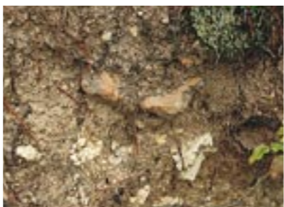
埴輪発見!(松江市大草町・岩船古墳)

復元された古墳では、石や埴輪はもとの場所に並べられています。実際の古墳の場合はどうでしょうか。墳丘の大きな古墳に行くと、その裾に転落した埴輪や葺石が見つかる場合があります。葺石はもとの位置に残っている場合もあります。墳丘の斜面に落ちていた木の下から見つかるかもしれません。