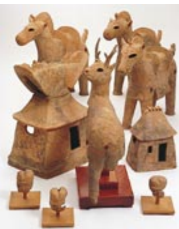
平所遺跡(松江市)出土品

写真に見える家や馬、人物のほか、戦いで使う刀や盾などの武器、ニリトリヤイノシシなどの動物、船などがあります。