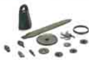
長瀬高浜遺跡出土品