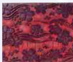
京紅板締「流水に桜」

それとともに、版木に彫られた文様の楽しさ、文様の意味、中国とも共通する近世末頃の庶民の願いを感じることができます。なお、中国藍夾纈資料の一括展示は日本初の試みです。