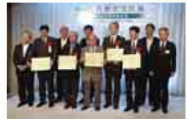
古代文化賞受賞者・各県知事・知事代理・選定委員長