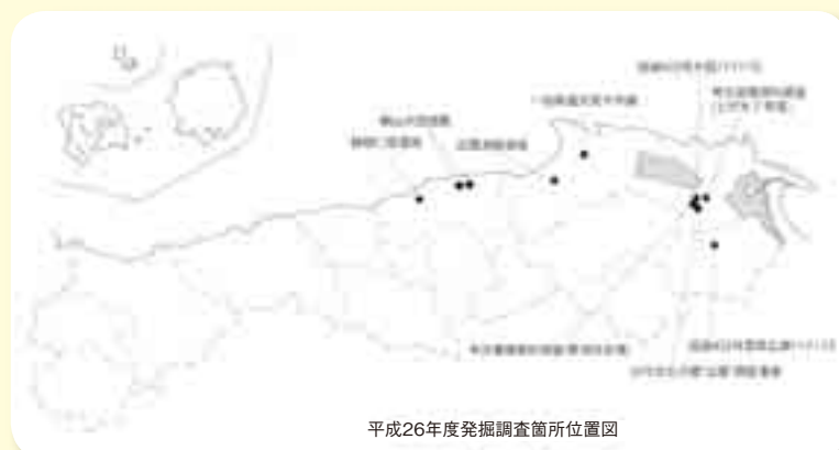
平成26年度発掘調査箇所位置図

これらの遺跡の調査成果については、発掘調査現地説明会やリーフレットなどで随時お知らせします。島根の古代の様相を解明する新発見にご期待ください。