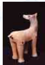
四条古墳鹿形埴輪