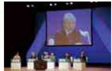
古代歴史文化賞パネルディスカッション

このように、古代文化センターでは、研究機関としての存在意義を、本来の歴史や文化の研究を通して発揮するとともに、県内外の方々に島根の情報を発信する拠点として様々な事業を展開していきます。事業の様子やイベントの募集などもここでも周知していきます。ご期待ください。