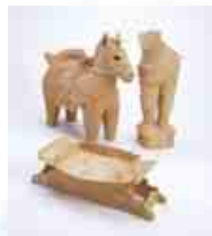
石屋古墳 埴輪 3点

「王権から遠い存在」と評価されてきた出雲のイメージに、一石を投じる刺激的な内容になっています。ご期待ください！