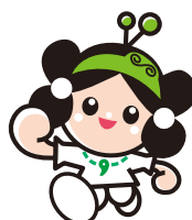
マスコットキャラクター 雲太くん