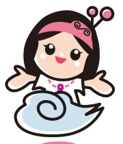
マスコットキャラクター 出雲ちゃん