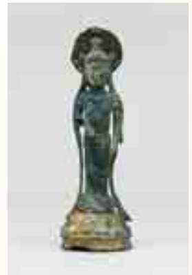
国宝 伯耆一宮経塚出土 金銅観音菩薩立像 (倭文神社蔵)

これが、「入り海の記憶—知られざる出雲の面影—」という、謎めいた本展覧会のタイトルのゆえんですが、是非、館にお越しいただき、出雲の地を育んだ「入り海」のあゆみ、そして、本展覧会のタイトルに込められた意味を味わっていただければ担当者として嬉しく思います。