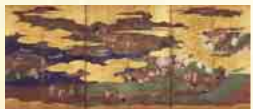
漁労図屏風 右隻（サントリー美術館蔵） 〔会期中右隻・左隻の展示替えあり〕