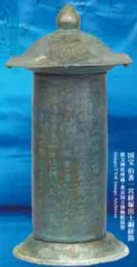
国家指定 宮縣出土銅柱 徳文館蔵 出雲国立博物館蔵 Shimane Pref. Izumo Archives