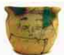
加茂遺跡出土土人面墨書土器 （津幡町教育委員会蔵）