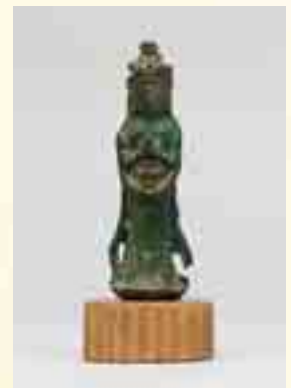
国宝 伯耆一宮経塚出土 銅造千手観音菩薩立像 （倭文神社蔵）