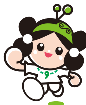
マスコットキャラクター 雲太くん