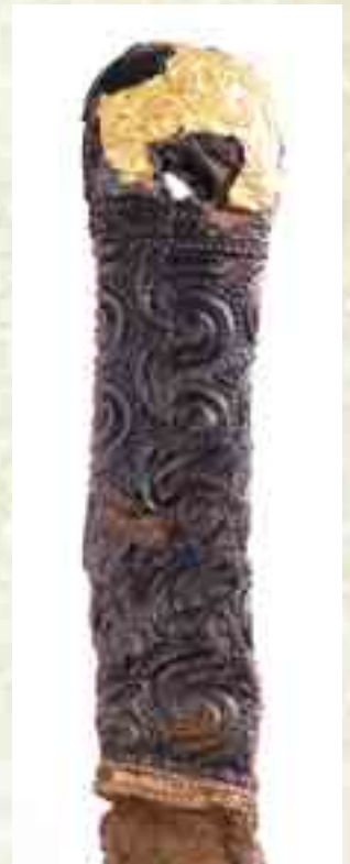
鳥居松遺跡(静岡県浜松市)の円頭大刀(部分:6世紀) 川に投じて捧げられた豪華な飾り大刀。地域首長がおこなう祭祀とみられ、同様の事例は出雲でも認められる。

ところで、ご存じのように『古事記』『日本書紀』には出雲がたびたび登場し、特に神話の舞台として大きな役割を果たしますが、出雲がそのような「神々の国」としての特別な性格を帯びた背景はどこにあるのでしょうか？ 杵築大社の創建や出雲国造の神賀詞奏上儀礼といった事柄が端的ですが、それだけでなく、8世紀の出雲国には極めて多くの神社が実在し、建築物としての社殿出現が早いというような、具体的な特異点があることがわかってきました。王権神話の形成にあわせて他地域に先駆けるように、出雲国をあげて独特な祭祀形態の整備が進んだ可能性が考えられます。そうした出雲に関わる謎にも歴史学の視点から迫っていく、というのが本研究の目的のひとつです。こうした研究成果の一端は、今年10月9日から11月29日まで開催予定の企画展「古代出雲の祭祀世界 - 神 人 祈り(仮)」で公開して参ります。どうぞご期待ください。