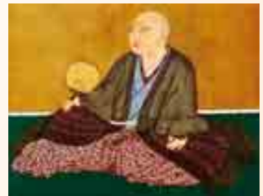
細川藤孝(幽斎)像[部分](永青文庫蔵)