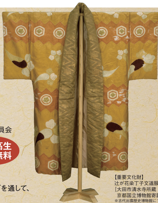
【重要文化財】 辻が花染丁子文道服 [大田市清水寺所蔵・ 京都国立博物館寄託] ※古代出雲歴史博物館にて展示