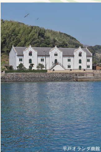
平戸オランダ商館

濃茶席・薄茶席・点心席・入館券付 (石見銀山資料館・重要文化財 熊谷家住宅) ※茶券は事前申込みが必要です。