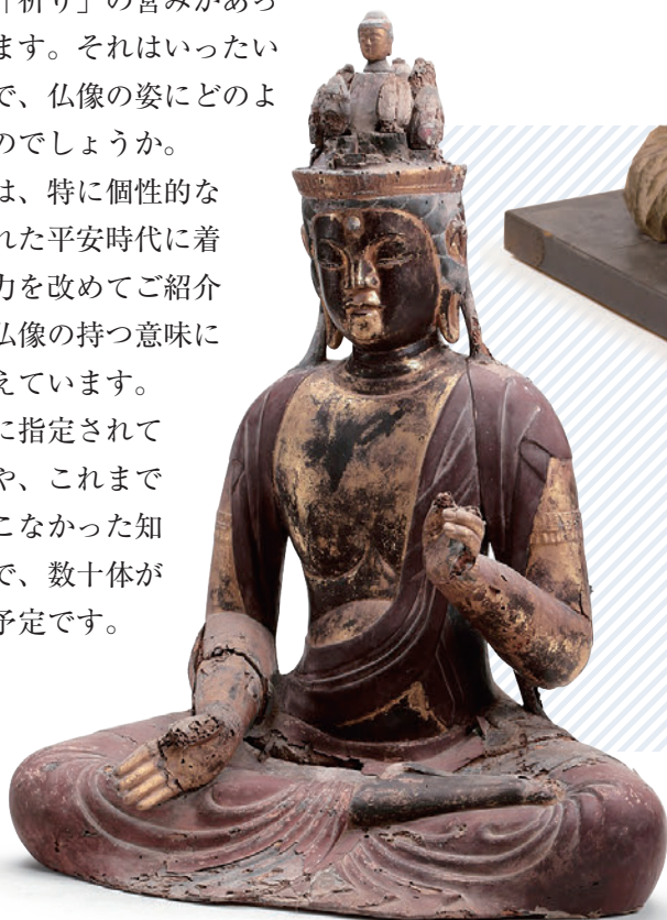
◀十一面観音菩薩坐像 （雲南市・長安寺所蔵〔金成地区観音堂伝来〕）