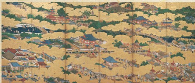
洛中洛外図屏風 右隻