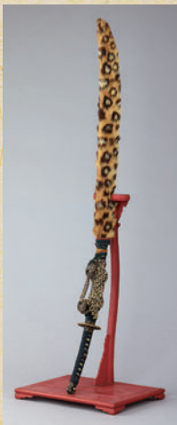
三星梶葉入糸巻太刀拵