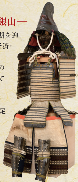
【重要文化財】 銀小札白糸威胴丸具足