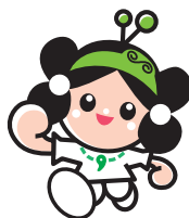
マスコットキャラクター 雲太くん