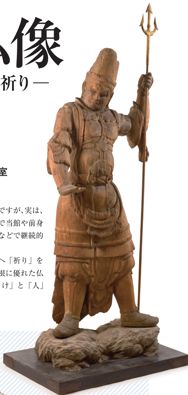
▲【重要文化財】四天王立像（持国天） （出雲市・万福寺所蔵）

この展覧会では、特に個性的な仏像が多く造られた平安時代に着目し、仏像の魅力を改めてご紹介するとともに、仏像の持つ意味にも迫りたいと考えています。国の重要文化財に指定されている著名な仏像や、これまで広く紹介されてこなかった知られざる仏像まで、数十体が歴博に集結する予定です。ご期待ください。