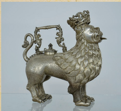
León coronado (王冠をつけたライオン)

世界史上、最も銀が活躍した時代、ボリビアのポトシ銀山は、西洋の社会・経済・文化に大きなインパクトを与えました。日本初公開となる銀器や絵画作品からポトシ銀山の歴史を紹介します。