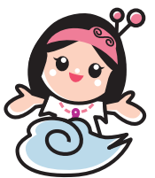
マスコットキャラクター 出雲ちゃん