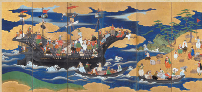
【重要文化財】南蛮屏風 左隻