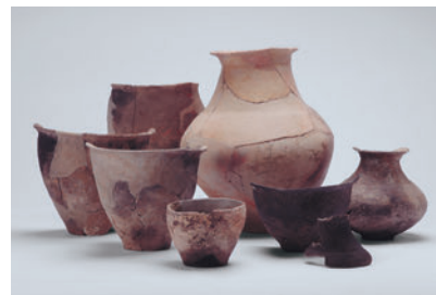
五丁遺跡出土の弥生土器(大田市)