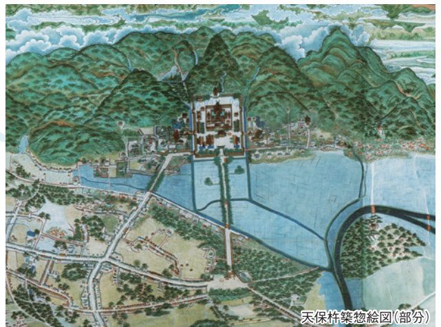
天保杵築物絵図(部分)