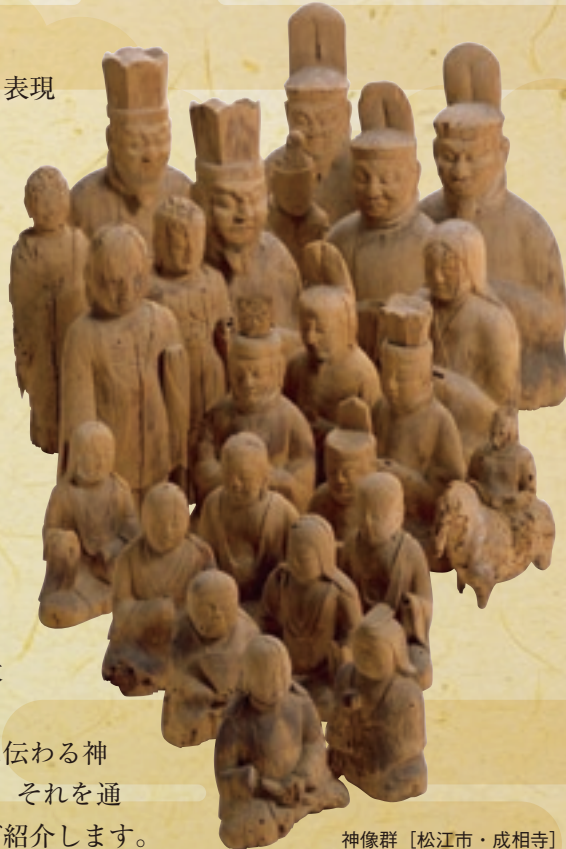
神像群 [松江市・成相寺]

本展の第2部では、島根に伝わる神像彫刻およそ200軀を展示し、それを通して神像彫刻の魅力や謎をご紹介します。