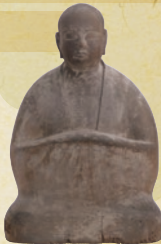
僧形神坐像 [益田市・櫛代賀姫神社]