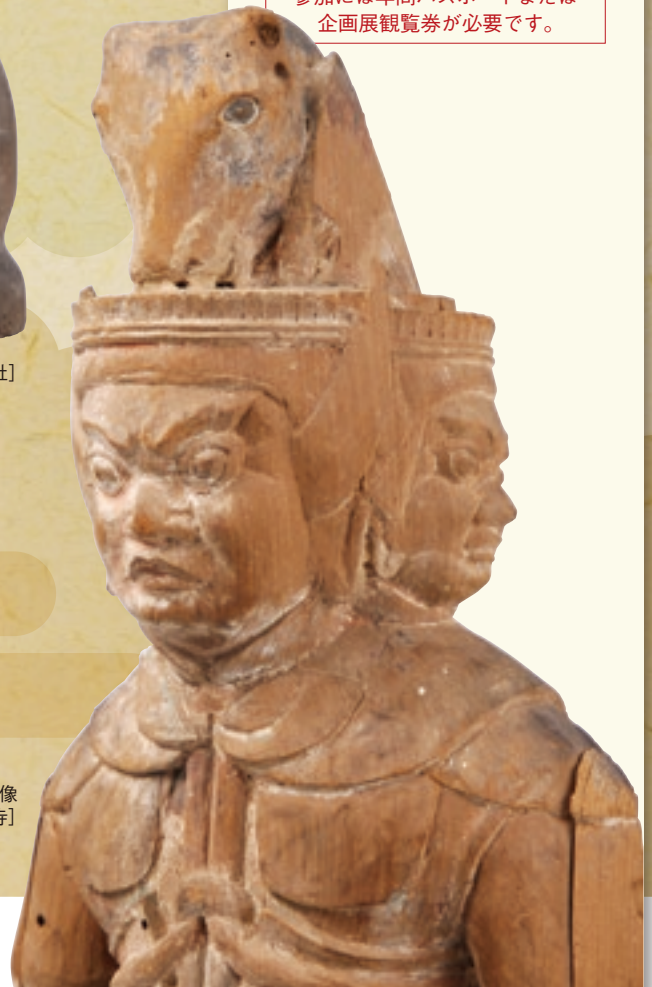
牛頭天王坐像 [出雲市・鱒淵寺]