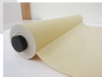
軸に太く和紙を貼り付けてある巻き物