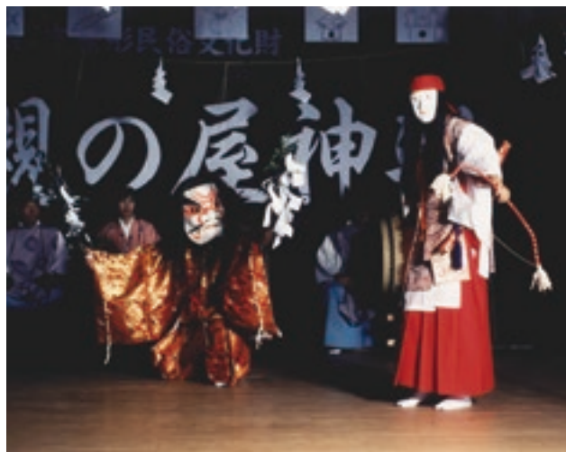
槻の屋神楽(日御碕)