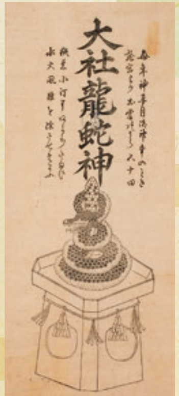
大社龍蛇神 [当館蔵]

神在月には神々が出雲に集まって縁結びの会議をする、というのが、現代の一般的な理解かもしれませんが、それにあやかろうと、秋にはたくさんの観光客の方々が出雲を訪れます。しかし長い歴史の中で、神々が出雲に集う理由については、縁結び以外にも神々の性格や10月という時期にちなんだ色々な説がありました。またその神徳が出雲だけでなく日本全国へ広まったのには様々な人々の活躍がありました。本展の第1部では、かつての人々が神在月とはどのようなものと考えていたのか、文献・民俗・絵画資料などを通してご紹介します。