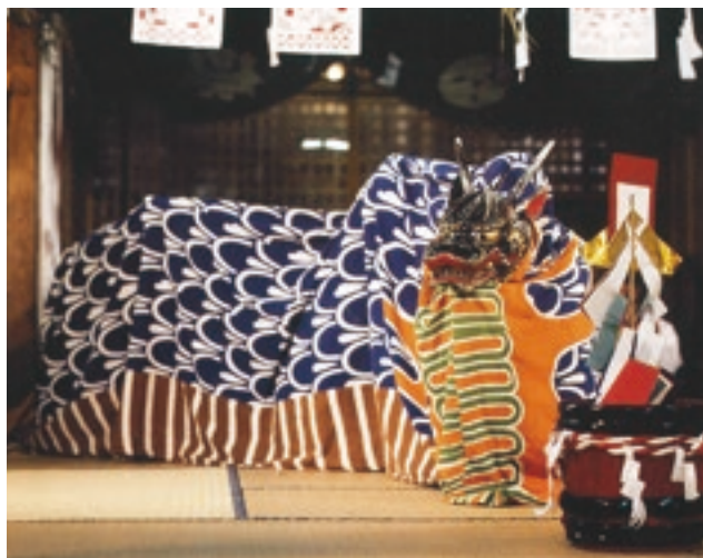
奥飯石神職神楽(八頭)