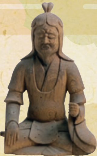
男神坐像 [出雲市・鱒淵寺]