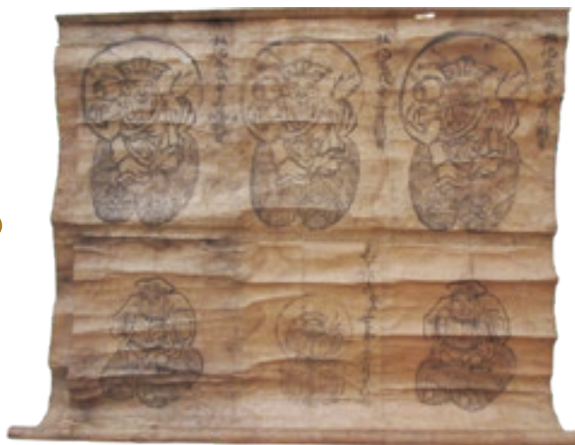
折れシワのできた資料

日頃から運動をしていないと、老いては腰が曲がるように、掛け軸や巻き物も、何年も巻いた状態のままにしておくと巻き癖がつき、開いた時に折れシワが生じます。特に軸(巻き芯)が細いほど、軸に近いところの紙ほど折れが生じやすくなり、やがてそこから表面が裂けてしまいます。折れシワを生じにくくするためには、軸をできるだけ太くする方法があります。近年は、軸に取り外しできる「太巻」を取り付けたりします。京都の優れた経師屋(びょうぶやふすまを仕立てるお店)さんのなかには、太巻のかわりに、巻物の軸に和紙を厚く貼りつけて、一見まだ開く余地があるように装丁を工夫してくれた店がありました。見えないところに配慮して、作品を傷めることなく後世に伝えるのも博物館の役割です。