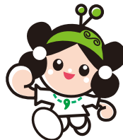
マスコットキャラクター 雲太くん