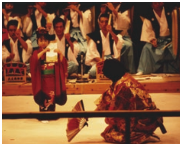
大土地神楽(莫塵舞)