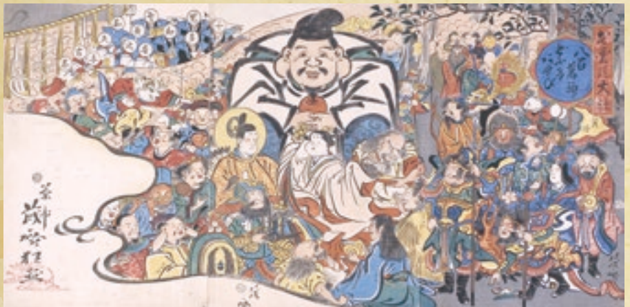
出雲の大社八百万神どうけあそび [当館蔵]