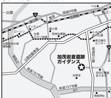
【第3講】加茂岩倉遺跡ガイダンス