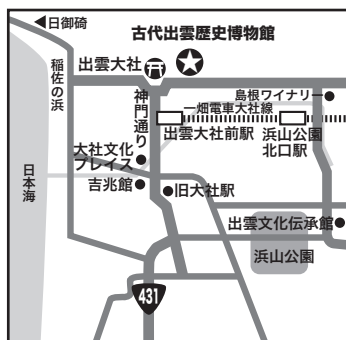
【第1講】古代出雲歴史博物館