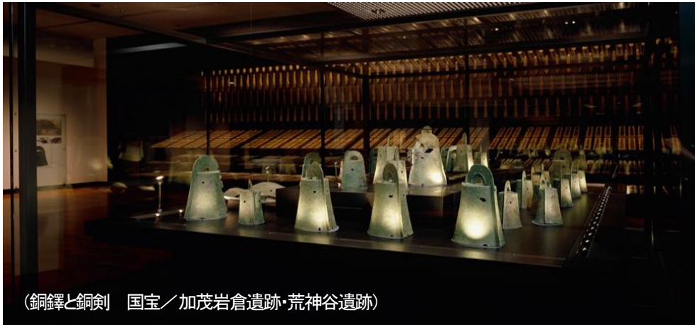
(銅鐸と銅剣) 国宝／加茂岩倉遺跡・荒神谷遺跡

◎ 島根県立古代出雲歴史博物館では、調査研究・展示とともに、学校との連携も重視しており、児童・生徒が島根の歴史や文化について興味・関心を高めることができるよう体験学習施設や、様々なプログラム、歴史学習教材などを準備しています。