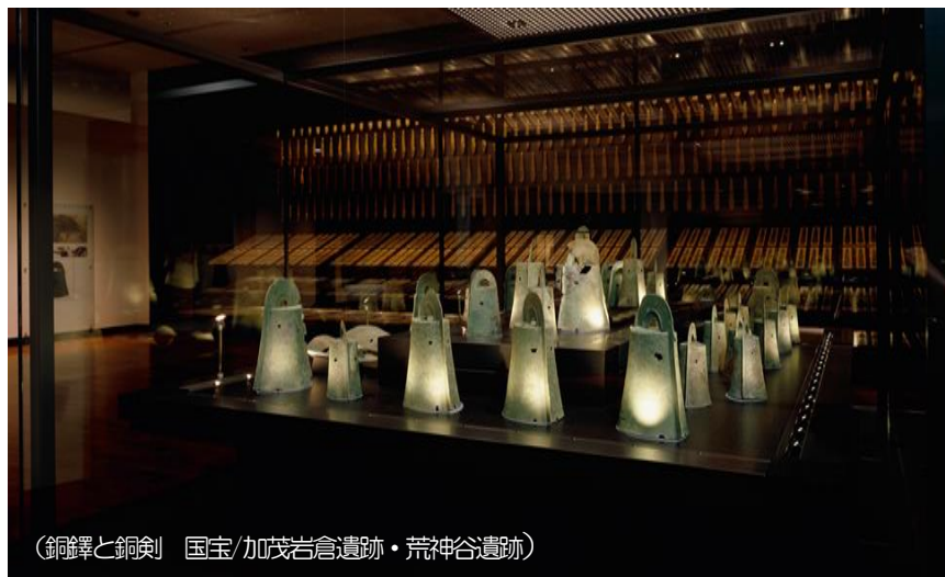
(銅鐸と銅剣 国宝/加茂岩倉遺跡・荒神谷遺跡)

◎島根県立古代出雲歴史博物館では、調査研究・展示とともに、学校との連携も重視しており、児童・生徒が島根の歴史や文化について興味・関心を高めることができるよう体験学習施設や、様々なプログラム、歴史学習教材などを準備しています。